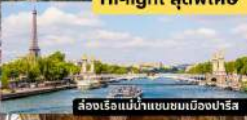
ล่องเรือแม่น้ำแซนชมเมืองปารีส