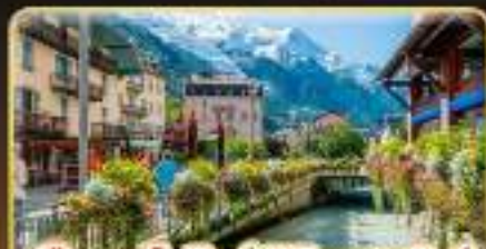
เยือนซาโมเน็กซ์ พิชิตมงบล็องก์