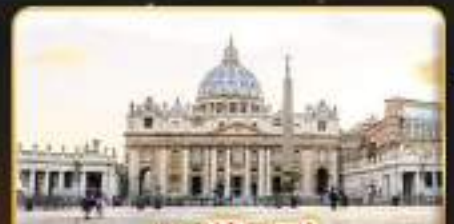
เซนต์ปีเตอร์