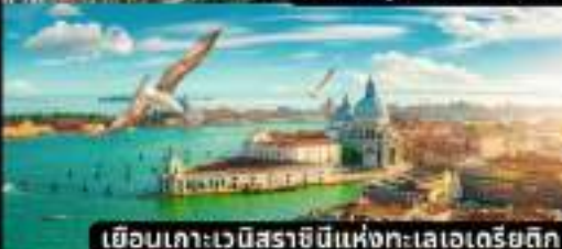
เยือนเกาะเวนิสราชมินแห่งทะเลเอเดรียติก

หอยแอสคาโก้ / / ฟองดูว์3อย่าง / สปาทเก็ตตีหมึกดำ