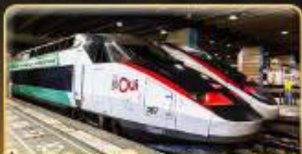
นั่งรถไฟความเร็วสูง PARIS - LYON