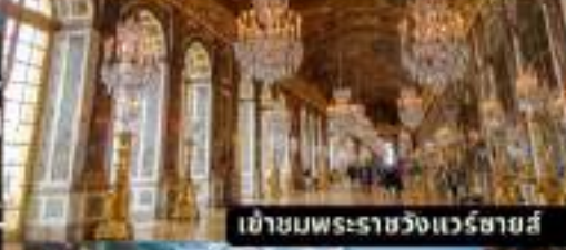
เข้าชมพระราชวังแวร์ซายส์