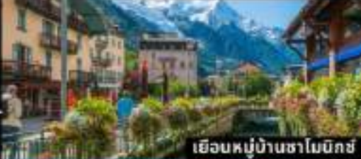
เยือนหมู่บ้านซาโมนิคซ์